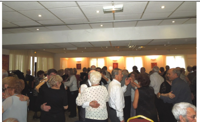
Ça danse, ça danse après le bon repas aux Palmiers