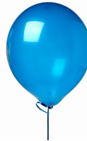
journée en blanc et bleu