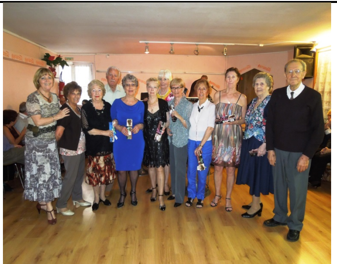
LES NATIFS D'AVRIL