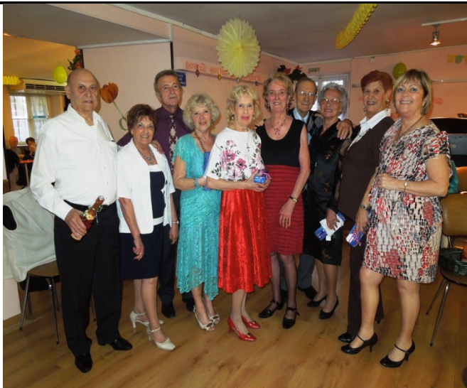
LES NATIFS DE MARS