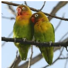
Les inséparables symboles de la fidélité