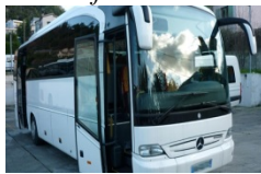
Notre bus BREMA indispensable pour nos sorties