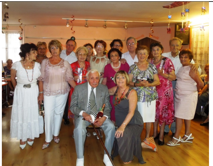
LES NATIFS DE JUIN

Publication et rédaction : Martine DUBUS Droits de reproduction réservés à l'Association Notre site : http://www.lesjoyeuxretraites.fr Email : lesjoyeuxretraites97@orange.fr