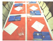
Repas du 14 juillet