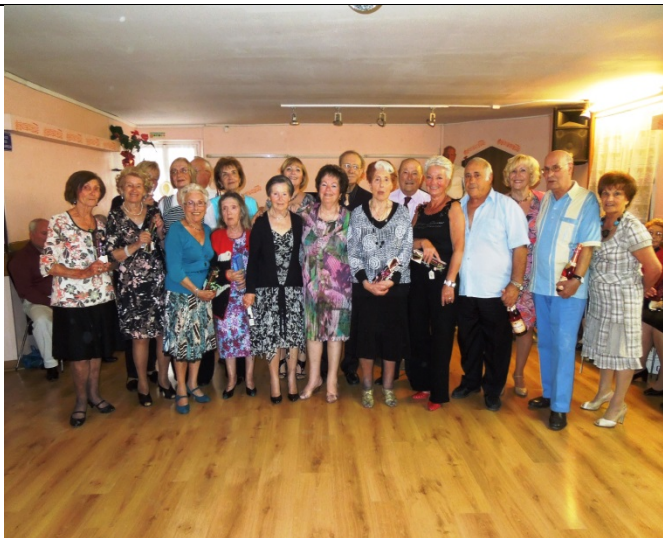
LES NATIFS DE MAI