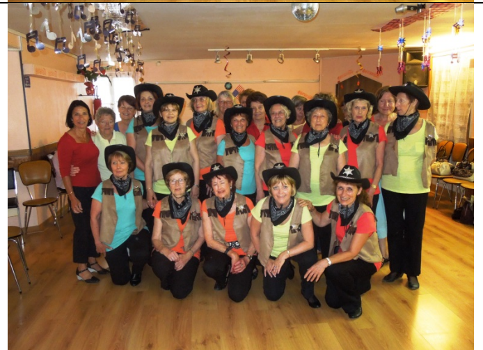
Les danseuses du cours de Country ont « assuré » avec leur démonstration pour la fête de la musique