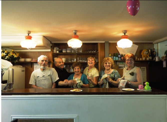
Les bénévoles réquisitionnés pour la fête de la musique : Travail dans la joie et la bonne humeur