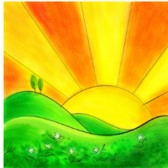
Enfin le soleil est arrivé