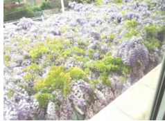
La glycine en fleurs