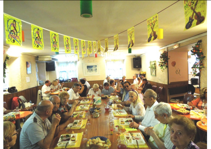
Soirée du 20 juin réussie avec les plateaux repas et l'ambiance au top !!!