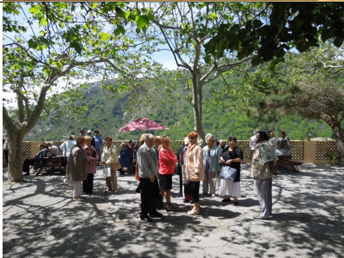
Gros succès aussi pour notre sortie à Utelle : une partie des participants attend l'apéritif près de la piscine