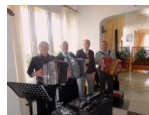
Nos musiciens et animateurs L'accordéon est roi