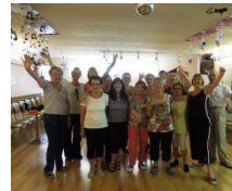
Les Gymnastes en forme